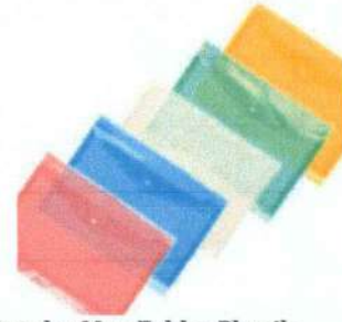
Standar Map Folder Plastik Bening